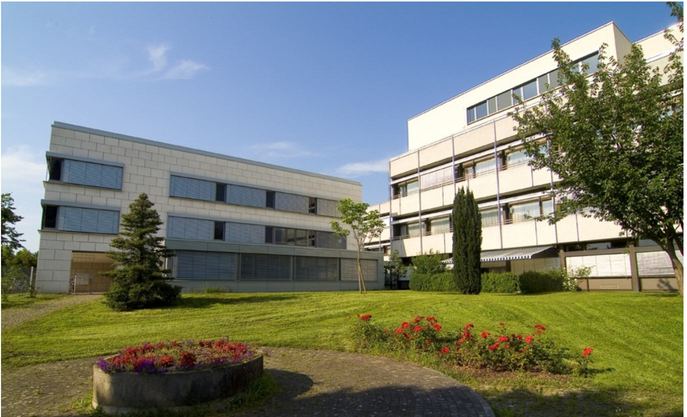
Abbildung: Rückansicht von Park auf Klinikgebäude und Ärztehaus

Die Klinik Sankt Elisabeth wurde im Jahr 1925 von den Schwestern vom Heiligen Josef im Münstertal als Geburtsklinik gegründet. In den Jahren von 1926 bis 1976 war die Klinik im Haus Felseck am Schlossberg untergebracht. In dieser Zeit erblickten dort ca. 40.000 Kinder das Licht der Welt. 1976 erfolgte der Umzug nach Heidelberg-Handschuhsheim in ein neu erbautes Klinikgebäude. In den folgenden Jahrzehnten wurde durch fachliche Erweiterungen aus der Frauenklinik Sankt Elisabeth eine moderne Belegklinik mit Betten in den Fachbereichen Geburtshilfe, Gynäkologie, Orthopädie und Plastische Chirurgie.